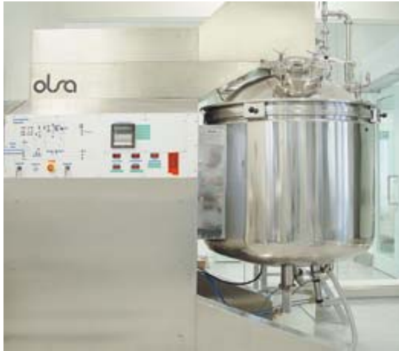
Pharmaproduktion in Mitlödi