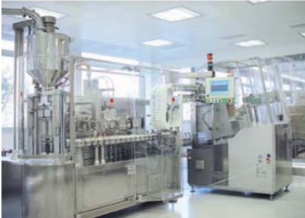
Pharmaproduktion in Mitlödi