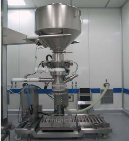
Rohstoffproduktion in Mitlödi

Grünenthal verfügt über die weltweit grösste Produktionsstätte zur Herstellung von Tramadol